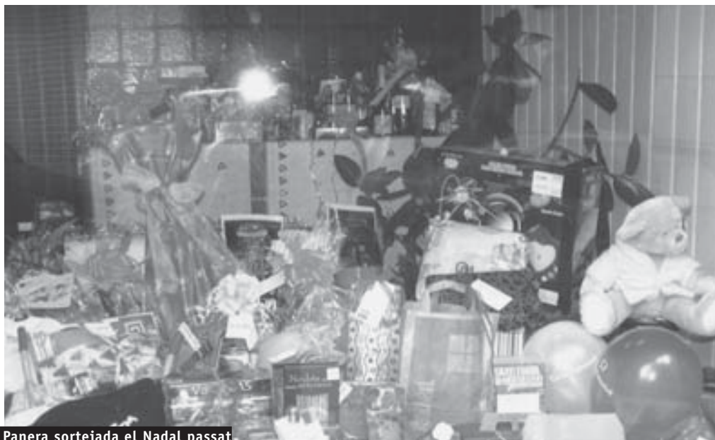
Panera sortejada el Nadal passat

Els darrers anys hem editat un vídeo o DVD, amb imatges gravades al llarg del curs pels mestres per tal que els pares puguem co-