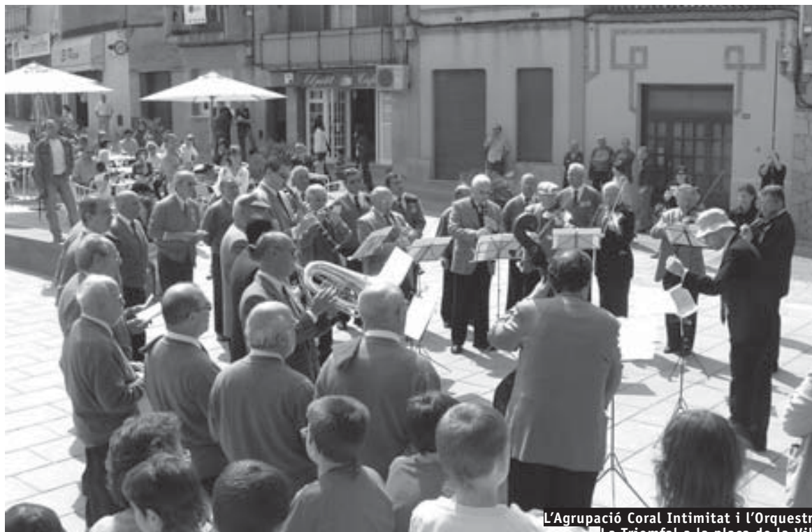
L'Agrupació Coral Intimitat i l'Orquestra La Triomfal a la plaça de la Vila

11 de setembre. Participació en l'ofrena floral davant el monument a Rafael Casanovas a Barcelona, juntament amb moltes altres corals de la Federació de Cors de Clavé.