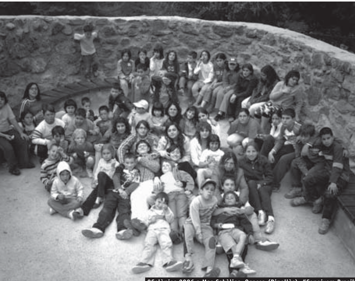
OColònies 2006 a Mas Cabàlies, Ogassa (Ripollès). "Coneixem Brasil"

S í. Seguim treballant. Treballant en l'educació en el lleure, promovent valors importants com la companyonia, la solidaritat, el respecte i l'estima al nostre entorn natural i la interculturalitat.