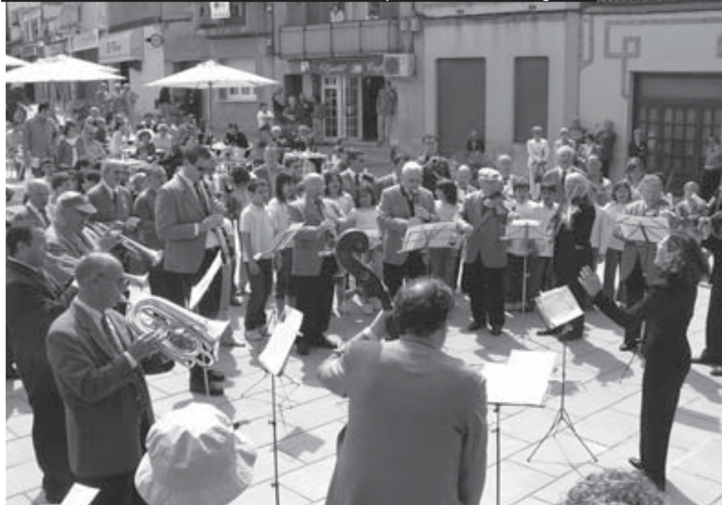
L'AC Intimitat, el Cor Infantil del CEIP Montcau i l'Orquestra La Triomfal d'Igualada

d'ara fem una crida per a comptar amb la complicitat i col·laboració de totes les entitats gelidenques, institucions públiques, comerciants i tots aquells voluntaris que vulguin col·laborar... Ja en parlarem!!! ☺