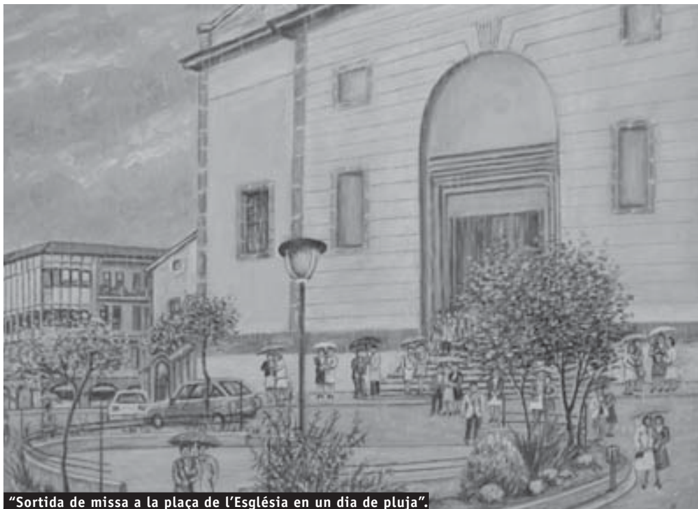
"Sortida de missa a la plaça de l'Església en un dia de pluja". Una altra escena de la vida a Gelida. Obra de Francesc Larrull

Animem tots els gelidencs i gelidencques, i les nombroses persones relacionades amb Gelida, a col·laborar amb la Fundació, en el que creguin que poden ser més útils, aportant-hi el que bonament puguin, encoratjant-los a implicar-s'hi en la mesura de les seves possibilitats. De ben segur que trobarem l'encaix adequat