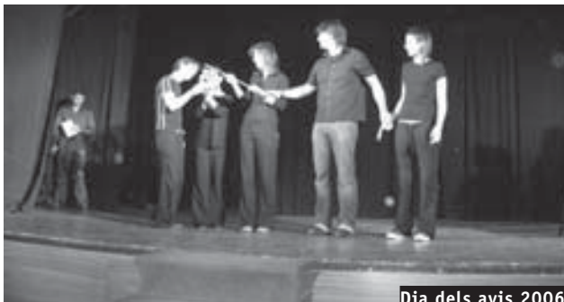
Dia dels avis 2006