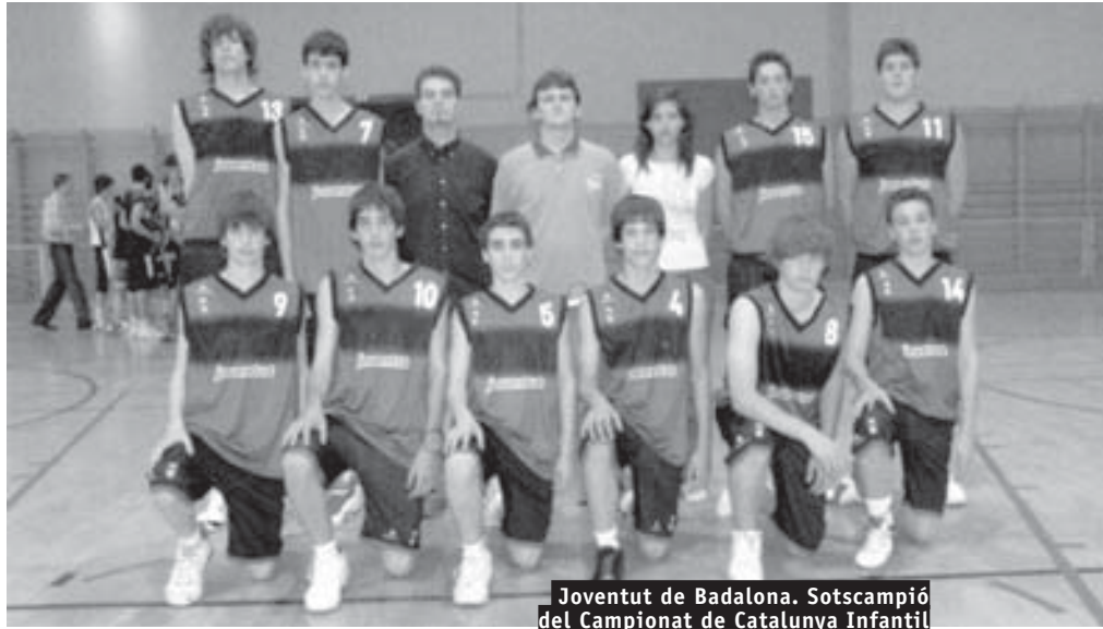
Joventut de Badalona. Sotscampió del Campionat de Catalunya Infantil

FINAL CAMPIONAT DE CATALUNYA INFANTIL. Per primera vegada en la història de la nostra comarca, la Federació Catalana de Bàsquet concedeix a un Club del Penedès, en aquest cas el CE GELIDA, d'organitzar la celebració de la Final del Campionat de Catalunya Infantil.