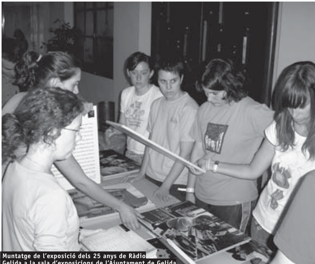
Muntatge de l'exposició dels 25 anys de Ràdio Gelida a la sala d'exposicions de l'Ajuntament de Gelida