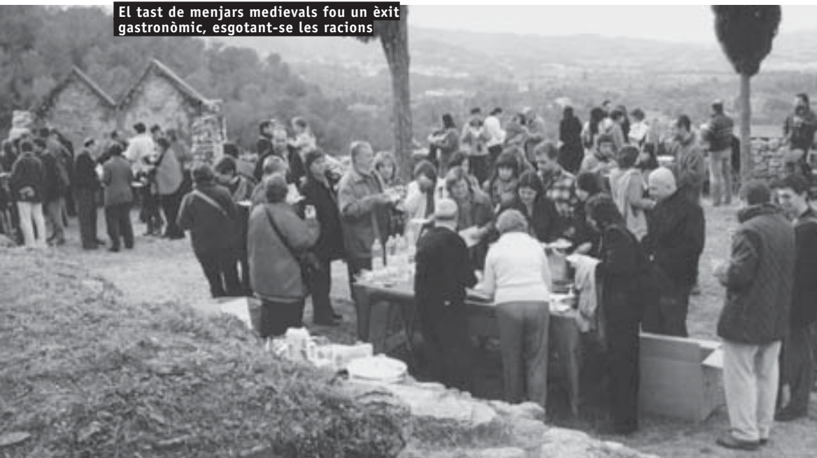
El tast de menjars medievals fou un èxit gastronòmic, esgotant-se les racions