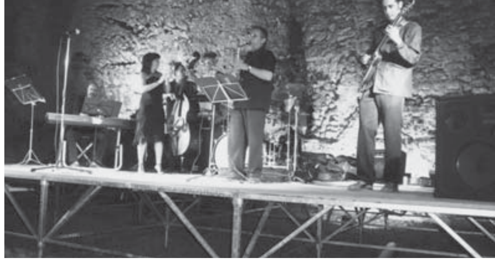
El 13 d'agost, el grup de jazz Pixie & Dixie ens sorprengué en gran manera.

s'havien proposat en el moment del disseny del projecte.