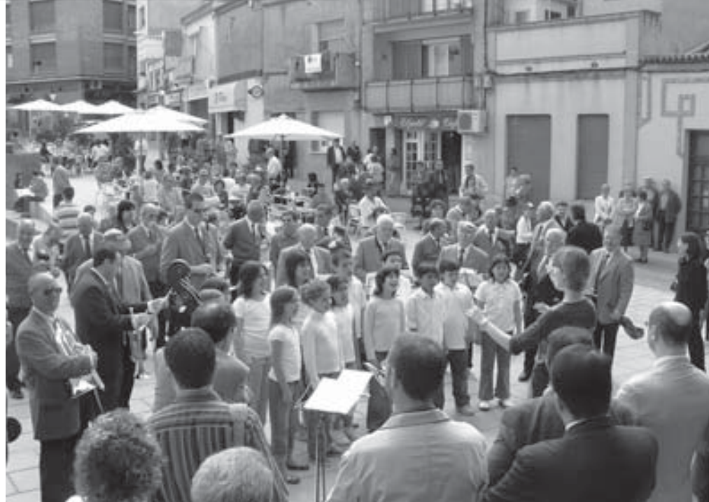
L'AC Intimitat i el Cor Infantil del CEIP Montcau

dir, el 15 d'abril del 2007. Això suposa la presència de 24 o 25 corals amb els seus acompanyants, total unes 1.200 persones.