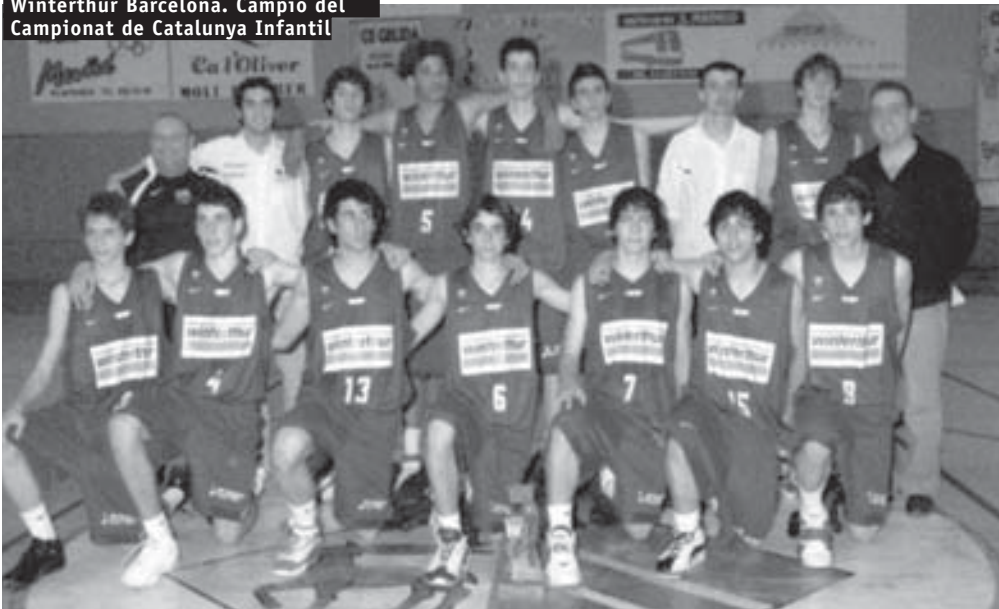
Winterthur Barcelona. Campió del Campionat de Catalunya Infantil

collida de dades i de documentació feta amb motiu de l'exposició dels 65 anys ha estat el que ha permès activar la idea de fer un llibre commemoratiu. Amb l'ampliació de la recerca de dades i amb l'aportació de comentaris i vivències de diferents persones s'ha pogut confeccionar un llibre que no pretén pas ser exhaustiu, però que, de ben segur, dóna a conèixer moments i situacions relacionats amb el món del bàsquet probablement poc coneguts. Va ser presentat per Sant Jordi en l'edició que el Club ha fet per als socis. Aviat sortirà l'edició popular dins la col·lecció RAIMA que edita la Regidoria de Cultura.