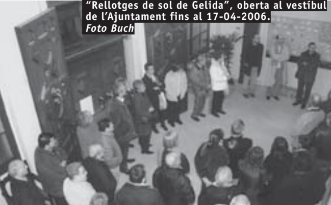
Acte inaugural, el 16-11-05, de l'exposició "Relotges de sol de Gelida", oberta al vestíbul de l'Ajuntament fins al 17-04-2006.

gressivament molt a prop. Un nou pas és ja en marxa amb una important intervenció per a completar les instal·lacions del Centre d'Interpretació, millorar la seguretat i l'estabilitat de diverses estructures, la senyalització del conjunt, les infraestructures per a la realització d'activitats i els accessos, tant al Centre d'Interpretació com especialment a la part superior de la fortificació, que serà així accessible fins i tot per a persones amb mobilitat reduïda. Aquesta intervenció és finançada per les aportacions de l'1% cultural de la Generalitat de Catalunya i del Ministeri de Foment.