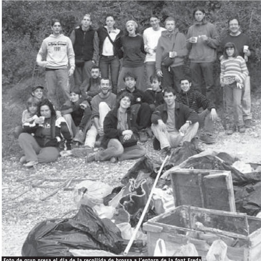
Foto de grup presa el dia de la recollida de brossa a l'entorn de la font Freda

Confiam en la voluntarietat, l'esperit crític i les ganes de fer coses de tots els joves i les joves perquè de mica en mica puguem anar suplint les petites mancances que el nostre municipi té envers el jovent del poble en els diversos àmbits de la nostra quotidianitat.