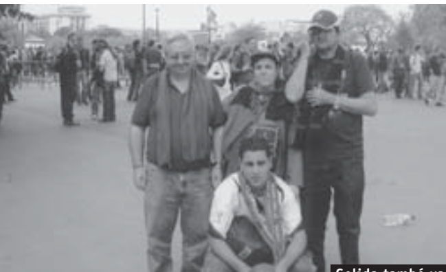
Gelida també va ser a la final de París