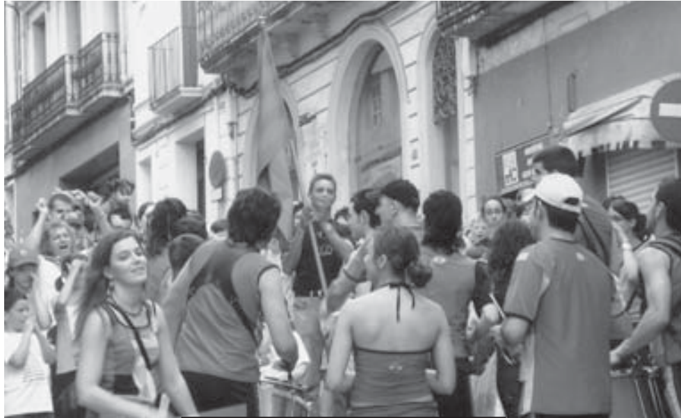
Celebració dels títols de la temporada a Gelida

I feliços els que el Barça portem cor endins, que això ja ho acabo amb tretze rodolins. ☺