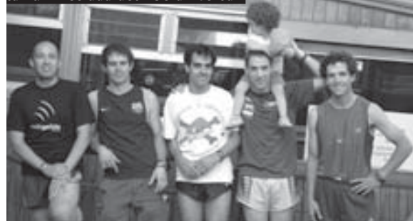
Els atletes del córrer x córrer després de la Funimetrada del 25è aniversari

teriors a Nou Barris. Lesions, estats de baixa forma, així com indisposicions diverses, en un grup no gaire nombrós, ens han passat factura. No per això hem deixat de participar a curses, portant el nom